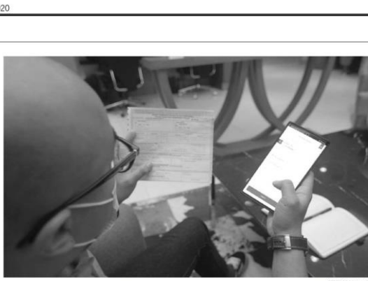
BAYAR PBB MENGANALOGI OCTO MOBILE : Nasabah melakukan pembayaran Pajak Bumi dan Bangunan (PBB) menggunakan OCTO Mobile di Jakarta, Selasa (18/8/2020). Dengan solusi perbankan OCTO Mobile yang menyediakan pembayaran non tunai dan tanpa kontak fisik, nasabah tidak perlu khawatir tertular virus COVID-19 karena dapat dilakukan kapan saja dan di mana saja. Layanan ini sekaligus wujud nyata dukungan CIMB Naga untuk meningkatkan penerimaan negara.

Kard, kartu pembayaran yang diterbitkan oleh Bank DKI sudah digunakan sebagai alat pembayaran tol di berbagai moda transportasi layanan publik seperti TransJakarta, Mikro Trans, Angkot Abi, Lingko, MRT Jakarta, LRT, hingga kereta bandara/Railink. ■